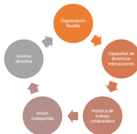
Figura 1. Componentes de las CAP

Las CPA en las escuelas, deben centrarse en el aprendizaje de los discentes, incentivando la colaboración entre educadores a través el intercambio de buenas prácticas y experiencias. Además, estar vinculados al perfeccionamiento continuo de la enseñanza, tomando decisiones basadas en datos y evidencias, y asumiendo una responsabilidad compartida por los resultados educativos. Del mismo modo, es fundamental que estas comunidades cuenten con una organización flexible, liderazgo distribuido y el apoyo activo de los líderes escolares, promoviendo una cultura de confianza, respeto y reflexión constante para asegurar su sostenibilidad a largo plazo.